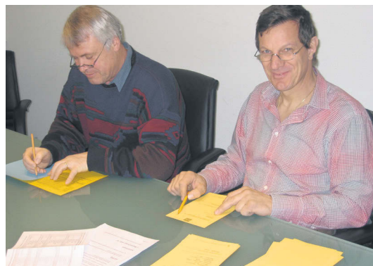
Die Wahlbüromitglieder sind zählbereit!

Es bleibt zu hoffen, dass sich genügend BewerberInnen melden, damit die Demokratie in der Gemeinde weiterhin vorbildlich funktionieren wird.