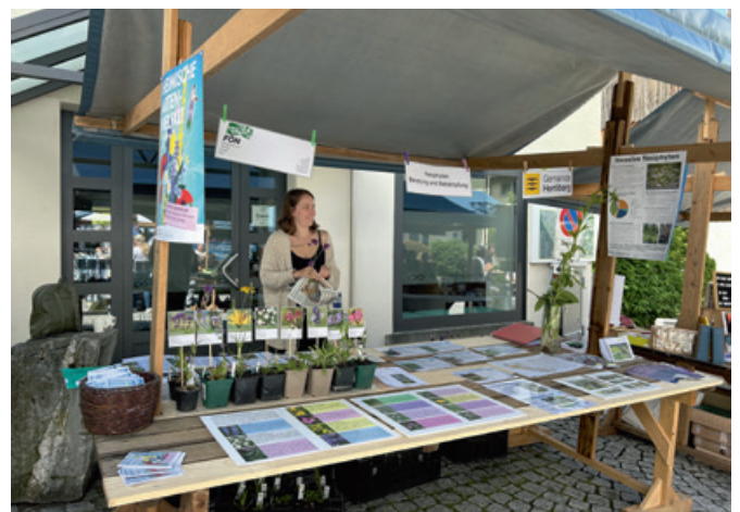
Eine Mitarbeiterin des Büro FÖN am Neophyten-Infostand am Frühlingsmarkt 2024.

Im Mai 2024 und 2025 war das Büro FÖN mit einem Neophyten-Infostand am Herrliberger Frühlingsmarkt vertreten, mit dem Ziel, die Bewohnerinnen und Bewohner über die Wichtigkeit dieses Themas zu informieren, das Bewusstsein für die Problematik zu erhöhen und die Akzeptanz für Bekämpfungsmassnahmen zu steigern. Es konnten Infobroschüren zu Neophyten, deren Erkennung und deren Bekämpfung verteilt werden. Auch fanden viele interessante Gespräche mit Beratungen aber auch ein allgemeiner Meinungs-austausch zum Thema statt. Die Besucher durften ein Quiz mit Fragen zu Neophyten und einheimischen Pflanzen beantworten und erhielten anschliessend als Geschenk eine einheimische Staude aus biologischem Anbau für ihren Garten.