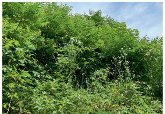
Essigbäume und Berufkraut auf einem privaten Grundstück, welche im Herbst 2024 bekämpft wurden.

Flächen der Gemeinde durchgeführt. Die bekämpften Arten werden jeweils gezählt dokumentiert und im GIS-Browser eingetragen. Dabei wurden vor allem das Einjährige Berufkraut ( Erigeron annuus ) mit über 2700 Exemplaren in vegetativem Stadium, beziehungsweise als Rosetten oder in blühendem Zustand, bekämpft. Dieser invasive Neophyt wurde auf fast allen zu kontrollierenden Standorten gefunden. Die zweithäufigsten invasiven Neophyten waren die Amerikanischen Goldruten ( Solidago sp. ) mit über 300 gejädeten Exemplaren. Die allermeisten davon konnten bereits vor der Blüte ausgerissen werden. Des Weiteren wurden kleinere Exemplare von Sommerflieder ( Buddleja davidii ) und Essigbäume ( Rhus typhina ) entfernt.