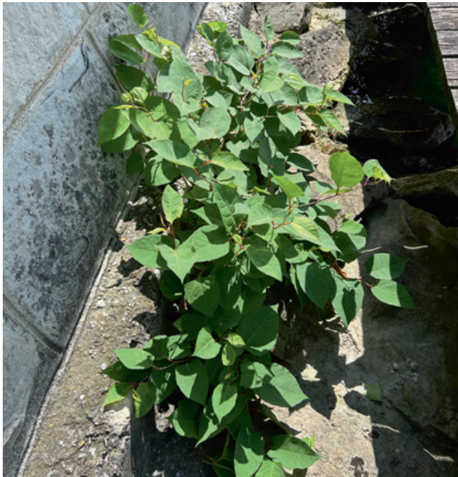
Japanischer Staudenknöterich am Hafen Herrliberg.

können und sich daraus neue Pflanzen entwickeln können. Standorte am Wasser begünstigen zudem die weitere Ausbreitung, da Pflanzenteile weggeschwemmt und an neuen Standorten wieder austreiben können. Die Pflanzen werden am Hafenstandort regelmässig durch Hitze mit einem Unkrautbrenner bekämpft und somit in Schach gehalten.