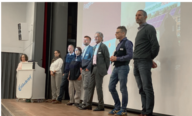
Ist eine Heizung gut konzipiert, ist erneuerbar günstiger als fossil: Informationsabend in Erlenbach am 15.4.2026

Dass die Pfannenstilgemeinden diesen Schritt leichter machen, haben sie am 14. und 15. April 2026 in Maur und Erlenbach gezeigt. Rund 300 Interessierte sind der Einladung zu Informationsabenden über Heizungsersatz gefolgt – hauptsächlich Hauseigentümerinnen und Hauseigentümer, die noch mit Gas, Öl oder elektrisch heizen.