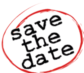
Save the date

Sonntag, 21. Juni 2026, ca. 11.30 Uhr, Kirche Tal, Herrliberg, anschliessend Apéro