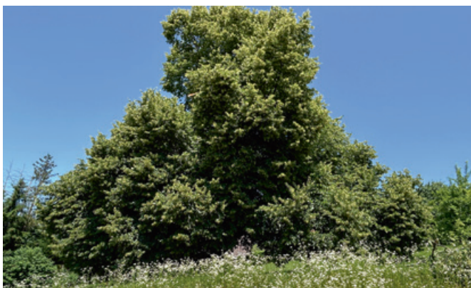
Private Fläche mit Berufkraut.

Der Japanische Staudenknöterich ( Reynoutria japonica ) ist an zwei Standorten mit je 5 bis 7 Exemplaren präsent. Durch eine regelmässige Bekämpfung und die relativ geringe Anzahl konnte eine weitere Ausbreitung bisher verhindert werden. Einer der Standorte befindet sich beim Hafen Herrliberg. Die Bekämpfung gestaltet sich hier nicht ganz einfach, da die Pflanzen aus Betonritzen und zwischen Steinen herauswachsen, was ein Jäten verunmöglicht. Die Pflanzen brechen beim Ausreissen ab, ohne die Wurzeln herausziehen zu können. Zudem ist bei der Bekämpfung von Knöterich am Wasser besondere Vorsicht geboten, da auch kleine Pflanzenteile rasch wieder Wurzeln bilden