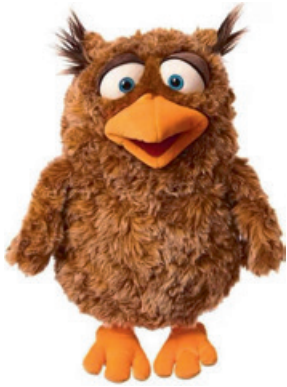
Üli, die Kircheneule