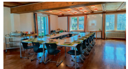
Alles ist bereit