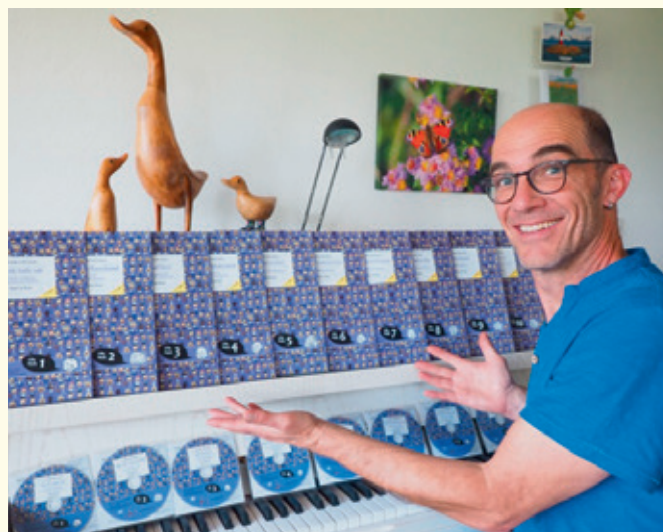
Organisator: Kulturkreis Herrliberg