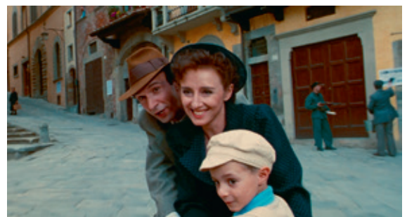
La vita è bella © MPLC Lizenz

Mittwoch, 1. April 2026, 19.00 Uhr, Kirche Tal, Herrliberg