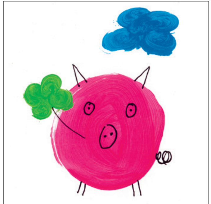
Ein glückliches Jahr 2026 wünscht Ihnen die Martin Stiftung. Zeichnung: Deborah, Werkgruppe