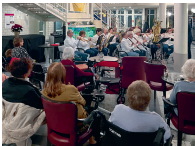
Abend-Konzert Musikverein Herrliberg.