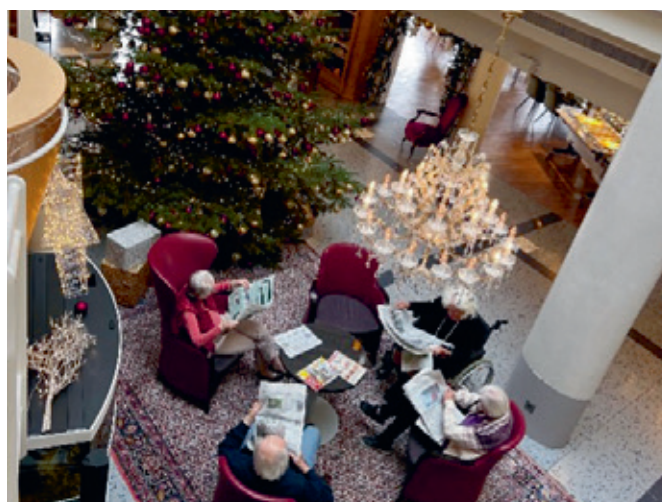
Gemütliches Beisammensein in der Adventszeit beim Weihnachtsbaum in der Halle von Senevita Im Rebberg.