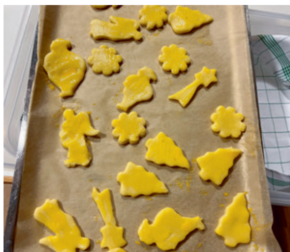
Weihnachts-Guetzli backen bei Senevita Im Rebberg mit Kindern vom Mittagstisch und Hort aus Herrliberg.