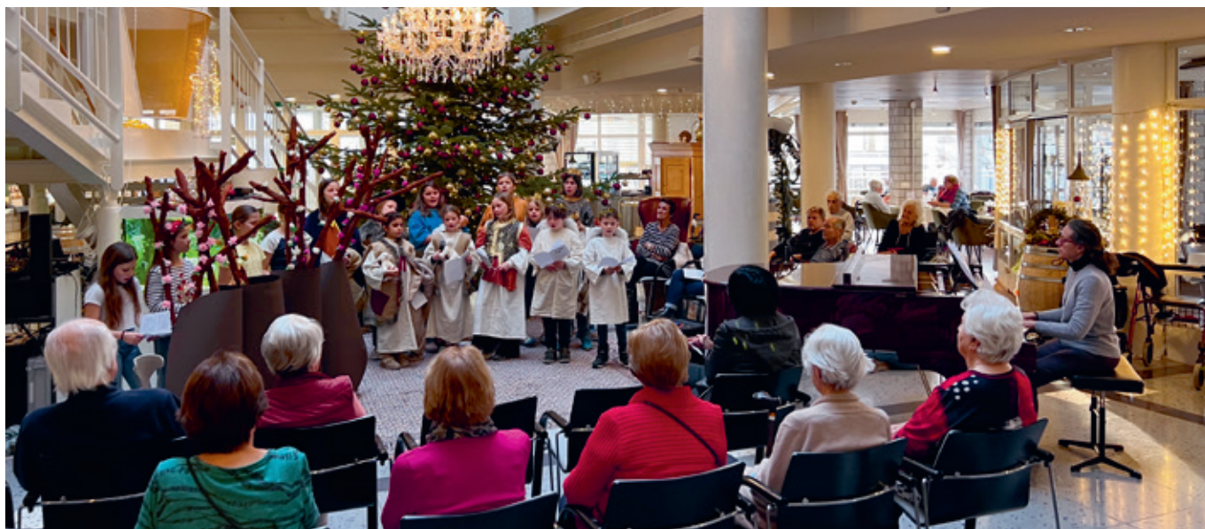
Krippenspiel katholische Kirche, mit Kindern aus der Gemeinde Herrliberg.