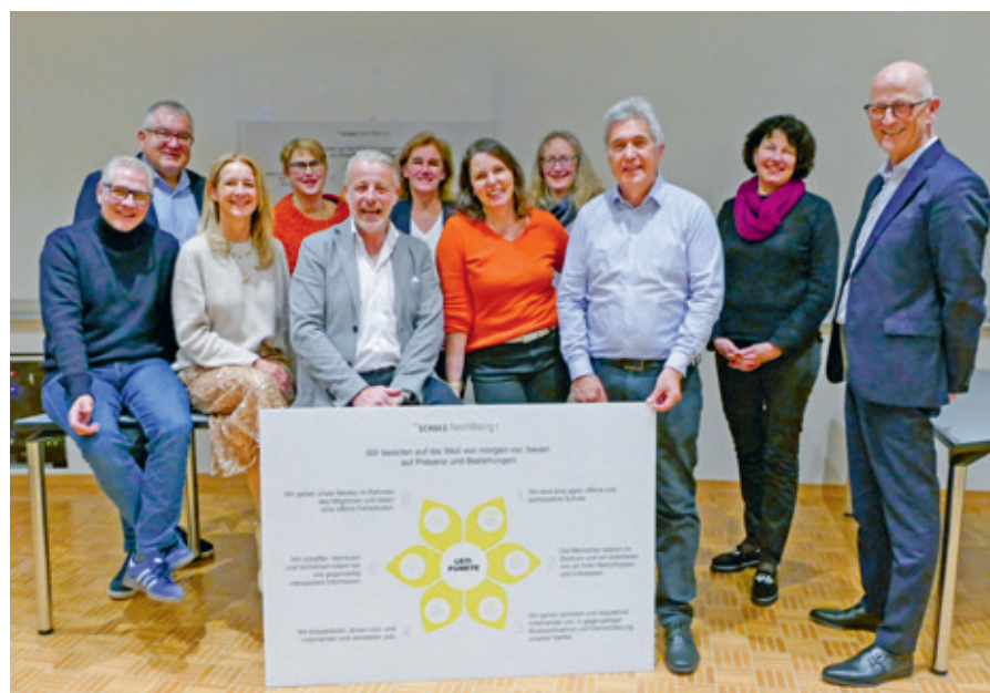
Schulpflege und Geschäftsleitung der Schule Herrliberg

Eltern, Schulbehörden, Lehrpersonen, Schulleitungen, Betriebsverwaltung, Bürgerinnen und Bürger sowie Steuerzahler – alle verfolgen dasselbe Ziel: eine gut funktionierende Schule mit einem qualitativ hochstehenden Unterricht. Das gelingt jedoch nur, wenn sich alle Beteiligten ihrer Rechte und Pflichten bewusst sind, die jeweiligen Zuständigkeiten wahrgenommen und respektiert sowie Polarisierungen vermieden werden. Die Schule gehört der gesamten Gemeinschaft, auch wenn mitunter jede und jeder den Eindruck haben mag, sie gehöre ihm oder ihr ein bisschen mehr als den anderen.