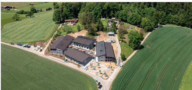
Die Eröffnung des Neubaus Rütibühl war ein grosses Highlight im Vorjahr. Auch im Jahr 2025 organisiert die Martin Stiftung wieder schöne Anlässe.

Vier grosse Anlässe und die Eröffnung des Neubaus Rütibühl: in der Martin Stiftung wurde im vergangenen Jahr viel gefeiert. Wir danken allen Herrliberginnen und Herrlibergern herzlich, die durch ihre Spende oder ihr freiwilliges Engagement einen wichtigen Beitrag geleistet haben und durch ihren Besuch unserer Anlässe schöne Begegnungen möglich machen.