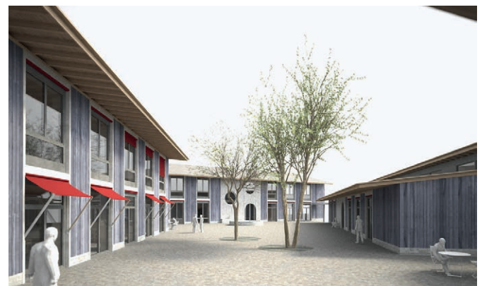
Neubau Rütibühl auf einer Visualisierung