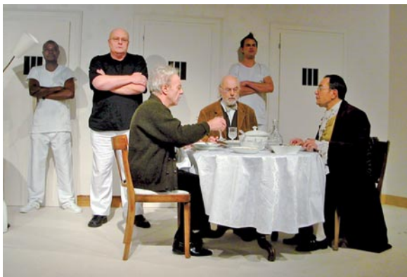
Die Physiker von Friedrich Dürrenmatt, 2005