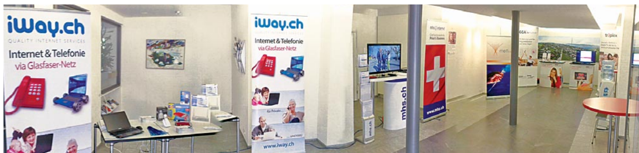
Der Service-Provider iWay.ch, mhs@internet und GGA maur stellen sich im Gemeindehaus vor.

Über hundert BesucherInnen nutzten die Gelegenheit, sich zu informieren. Aber auch nach dem Anlass ist guter Rat nicht fern: Die meifi.net-Experten beraten alle Kunden gern am Telefon 044 915 91 99.