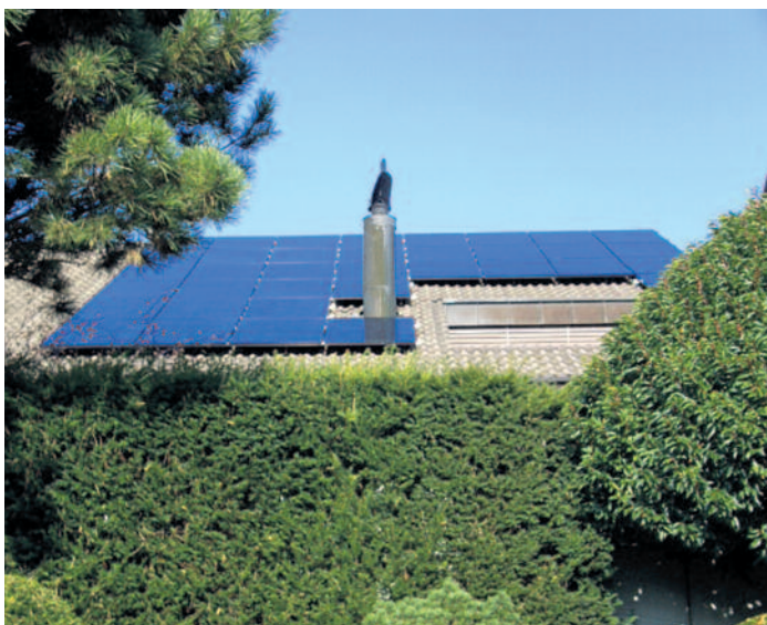
PV-Anlage von Daniel Schwitter

Nach dem Start Ende Februar 2016 waren innert kürzester Zeit 28 Plätze für eine Beratung vergeben. Die Bilanz ist erfreulich; insgesamt wurden bisher 9 Photovoltaik-Anlagen (PV-Anlagen) realisiert; davon 8 auf Einfamilienhäusern (EFH) und eine auf einem Mehrfamilienhaus (MFH). Die Zeichen der Zeit wurden erkannt und man will aktiv zur umweltfreundlichen Energiewende beitragen. Die Herrliberger sind aber auch aus guten Gründen fortschrittlich eingestellt – es gibt nur wenige Gemeinden, die PV-Anlagen so grosszügig unterstützen.