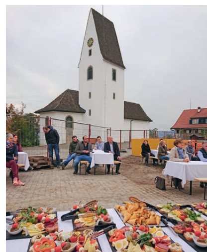
Das Architektenteam hat mit den Behördenmitgliedern, weiteren Hauptbeteiligten und der Lehrerschaft nach den Ansprachen einen Apéro genossen.