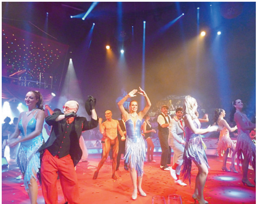
Finale in der Manege

Für einmal durfte zurückgelehnt und genossen werden. Emsiges Servierpersonal trug ein mehrgängiges, schmackhaftes Menü auf, und die Zirkusdarsteller aus verschiedenen Kulturen boten eine atemberaubende Show auf hohem Niveau. Ob Akrobatinnen mit drehenden Tellern und fliegenden Schalen, die Schlangenfrauen, der jonglierende Mann, dessen Gliedmassen aus Gummi zu sein schienen, durch die Luft wirbelnde Artisten, sie und viele andere versetzten das Publikum fortwährend in Staunen. Die Tanzeinlagen sorgten für Entspannung und die Clowns für Beanspruchung der Lachmuskeln.