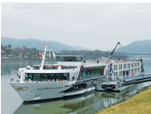
MS Excellence Queen

Der musikalische Abschluss bildete – nach einem geführten Rundgang durch die Weinstadt Krems in der Wachau – das Silvesterkonzert auf Schloss Grafenegg. Wir erlebten ein grossartiges Konzert mit Wiener Musik, das in Nichts dem traditionellen Neujahrskonzert der Wiener Philharmoniker nachstand. Selbstverständlich durfte am Silvester ein Feuerwerk nicht fehlen. Mit einem Glas Sekt in der Hand schauten wir auf dem Sonnendeck mal links, mal rechts den farbigen Bildern nach, die die Stadt Krems und die Crew unseres Schiffes in den Himmel zeichnen liessen. Der Schifftag am 1. Januar kam uns sehr gelegen, konnten wir doch etwas länger schlafen und das neue Jahr gemütlich angehen, bevor es zum 7-gängigen Galadiner ging. Am 2. Januar führte uns unser Klasse-Chauffeur nach Herrliberg zurück. Wir verabschiedeten uns in bester Laune und in der einhelligen Überzeugung, eine phantastische Woche erlebt zu haben. Alles war, wie es für «Excellence»-