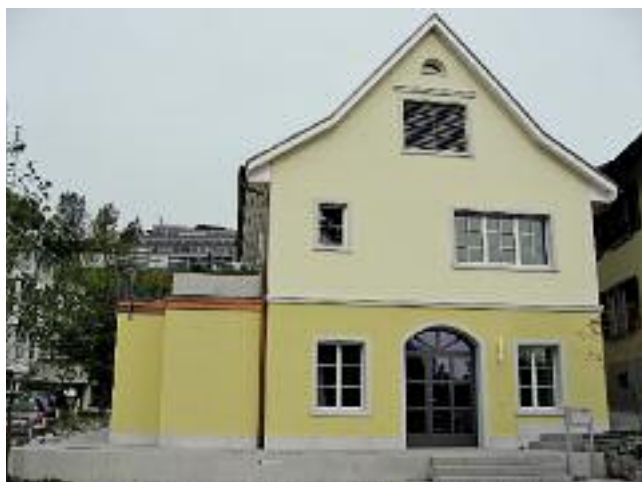
Das neue Jugendhaus

Das Jugendhaus wurde zum ersten Minergiebau der Gemeinde. Dank dem Erreichen des Minergie-Labels wurden von der Baudirektion Fr. 8'280 ausgerichtet. Aus der Herrlibergerhaus-Fonds wurde dem Zweck entsprechend ein Finanzierungsbeitrag von Fr. 220'000.00 entnommen.