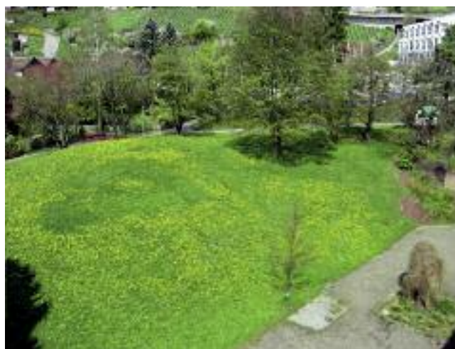
Geplanter Standort gegen Schulhausstrasse (rechts APH)

Die Liegenschaft an der Schulhausstrasse 45, in welcher das Chinderhuus für Kinder bis zum Kindergartenalter untergebracht ist, weist verschiedene Unzulänglichkeiten auf (Erstellungsjahr 1780) und müsste für eine weitere Nutzung umfassend saniert werden. Zudem ist die Nachfrage nach Krippenplätzen in Herrliberg über die letzten Jahre konstant hoch, so dass ohne Weiteres eine dritte Kindergruppe gebildet werden könnte, was allerdings im jetzigen alten Gebäude nicht realisierbar wäre.