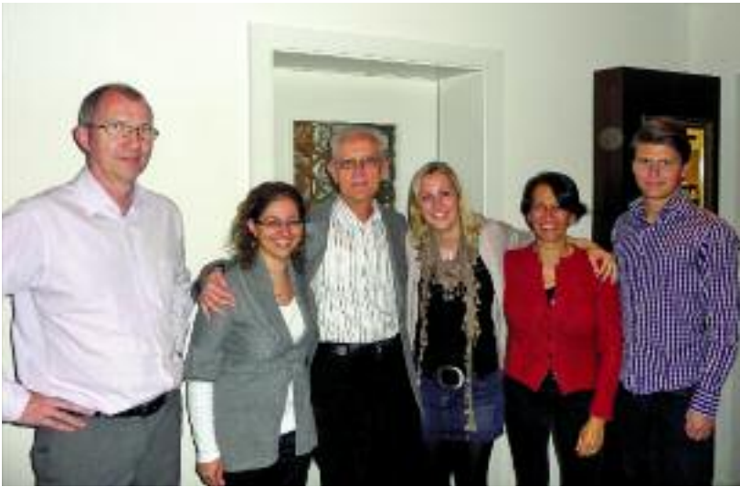
Das neu-alte Steuerteam