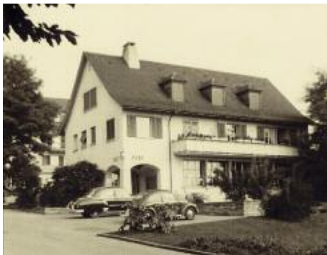
Postgebäude vor rund 55 Jahren

Wir bedauern, dass die Briefzustellung seit November 2010 nicht mehr ab Herrliberg erfolgt. Aus Gründen der Wirtschaftlichkeit werden viele Zustellorganisationen zusammengelegt. In unserem Fall ist die Briefzustellung nun bei der Post Meilen.