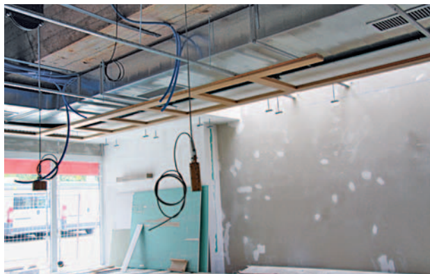
Arbeiten an der Aula-Decke

Zwischen Sommer- und Herbstferien waren die ruhigeren Arbeiten wie Fenstermontage, Wände verputzen, Lüftungs- und Elektrokanäle befestigen, Bohrarbeiten für die Deckenaufhängungen, installieren von verdeckter Bühnentechnik, komplettes Ersetzen von zwei Toiletten, neue Tüzzargen versetzen und vieles mehr angesagt. Die Bauleitung versuchte in Zusammenarbeit mit den Handwerkern, die Störungen der Unterrichtsstunden so gering als möglich zu halten. Lärmige Arbeiten sollten möglichst vor oder nach der Schule oder über die Mittagspause ausgeführt werden. Dies gelang meistens gut.