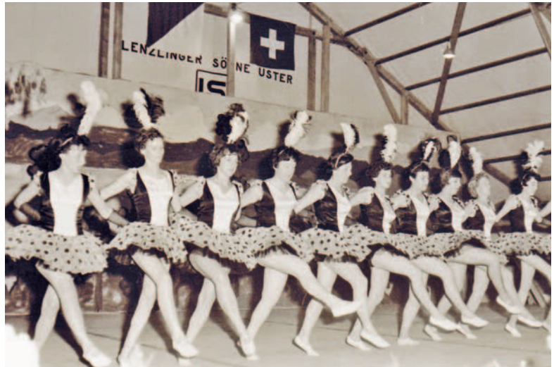
Wer tanzt hier am Gemeindefest vom 24. Juni 1961?