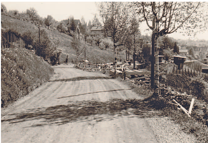
Die Habüelstrasse wird 1961 ausgebaut.