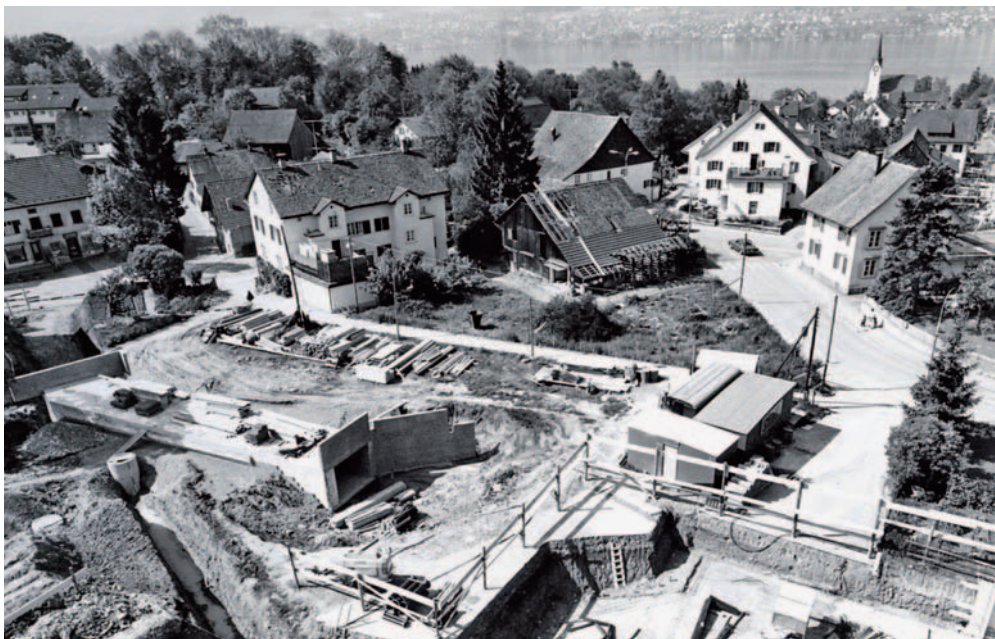
1974 erfolgte die Neuausrichtung Forchstrasse (Kantonsstrasse), was heute in diesem Bereich die Gestaltung eines Dorfcentrums stark erschwert (links ist die Unterführung zu erkennen).

Es werden mehr Begegnungsmöglichkeiten gesucht, z.B. mit einem Dorfcafé sowie Räume für das Gewerbe und Detaillisten. Es geht vor allem um den Bereich zwischen Dorfplatz und Alterssiedlung/Drogerie/Metzgerei. Hier wird der Gemeinderat mit den Betroffenen sowie Anstössern Kontakt aufnehmen und Konzeptideen veranlassen.