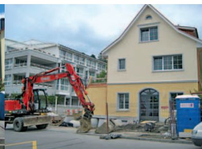
"Eglihuus" bald in neuem Glanz