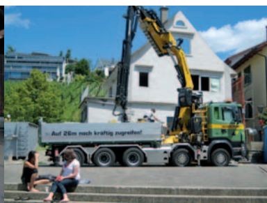
"Eglihuus" im Umbau