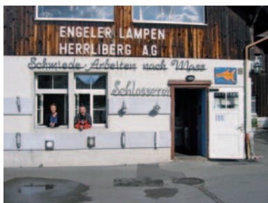
Jugendtreff seit 2001