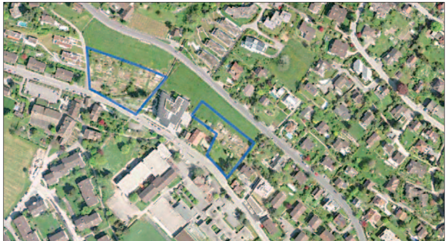
Im Areal links kann nach Umzonung ein Alterswohnprojekt in Frage kommen, auf der Parzelle rechts z.B. einmal eine Schulerweiterung

Mit der Umzonung der umrandeten Flächen ergäbe sich ein geschlossenes Gebiet der Zone für öffentliche Bauten (grau: Schule, APH, Jugendhaus, Kirchgemeindehaus – und neu für Alterswohnungen).