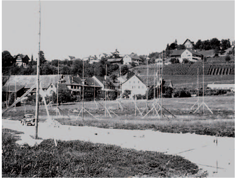
Die «Gartenstrasse» vor 50 Jahren