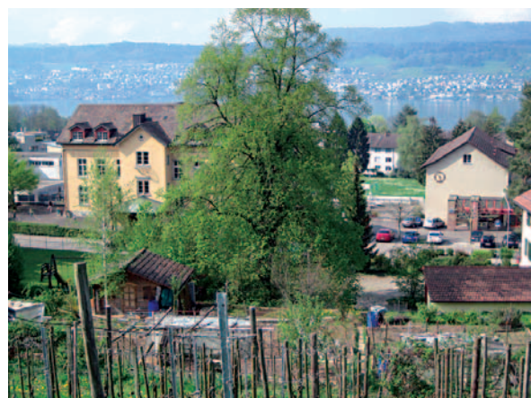
Areal südöstlich des APH, vis-à-vis der Schulhäuser: Umzonung unterhalb der Reben beantragt