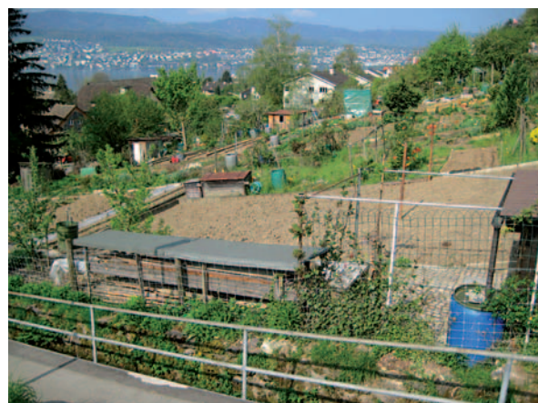
Areal zürichseits des APH, wo Alterswohnungen geplant sind

Östlich des APH resp. des Kirchgemeindehauses Büchschmitte (vis-à-vis des Schulareals) besitzt die Gemeinde eine weitere Parzelle, welche teilweise ebenfalls von Hobbygärtnern genutzt wird. Es macht Sinn, gleichzeitig auch diese umzuzonen, um allenfalls auf spätere Raumbedürfnisse der Schule oder der Kinderkrippe reagieren zu können.