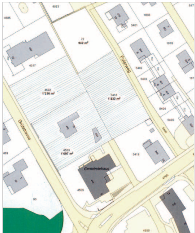
Die drei schraffierten Grundstücke zwischen Gemeindehaus und Schrebergärten (72) stehen zum Verkauf

Den drei Parzellen an zentraler Lage kommt vor allem wegen der Grenze zum Gemeindehaus grosse strategische Bedeutung zu. Zudem besitzt die Gemeinde am Fulerweg ein Grundstück mit 942 m 2 Fläche. Dieses hatte die Gemeinde 1977 als Vermächtnis erhalten und der Wert wurde gemäss Gemeindeversammlungsbeschluss vom 27. November 1991 im Sinne des Testaments für den Bau des Alters- und Pflegeheimes "Im Rebberg" verwendet. Zurzeit kann nicht konkret gesagt werden, wie dieses Land später genutzt würde. Neben künftigen Bedürfnissen der Gemeindeverwaltung - wo bekanntlich Besucherparkplätze fehlen bzw. nur provisorisch auf dem Postparkplatz zur Verfügung stehen - sind andere öffentliche Nutzungen denkbar. Die zentrale Lage in Nähe zur Post, zum Bahnhof und zum Coop sprechen für sich. Landreserven sind zudem wichtig, um allenfalls bei anderen Gelegenheiten Tauschobjekte anbieten zu können. Vor allem ist zu bedenken, dass die Chance an solcher Lage, falls überhaupt, nicht so schnell wieder kommt. Ein Verkauf an einen privaten Investor hätte mit grösster Wahrscheinlichkeit unverzüglich eine Überbauung zur Folge. Die Chance ist von der Gemeinde unter dem Motto "jetzt oder nie" wahrzunehmen.