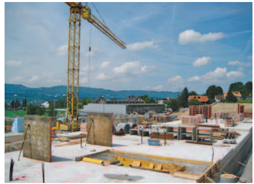
Baustelle Schützenmur am 16.5.08

Die Gemeindeversammlung hat am 8. Februar 2006 einen Baurechtsvertrag mit der Siedlungsbaugenossenschaft Herrliberg abgeschlossen. Rund 12'500 m 2 wurden im Baurecht abgetreten. Die Überbauung sieht 9 Häuser mit je vier Wohneinheiten vor. Etwa im April 2009 können die ersten MieterInnen einziehen. Im April 2010 sollten alle Häuser erstellt sein. Ursprünglich wurde mit Gesamtbaukosten von rund 17.5 Mio. Franken gerechnet.