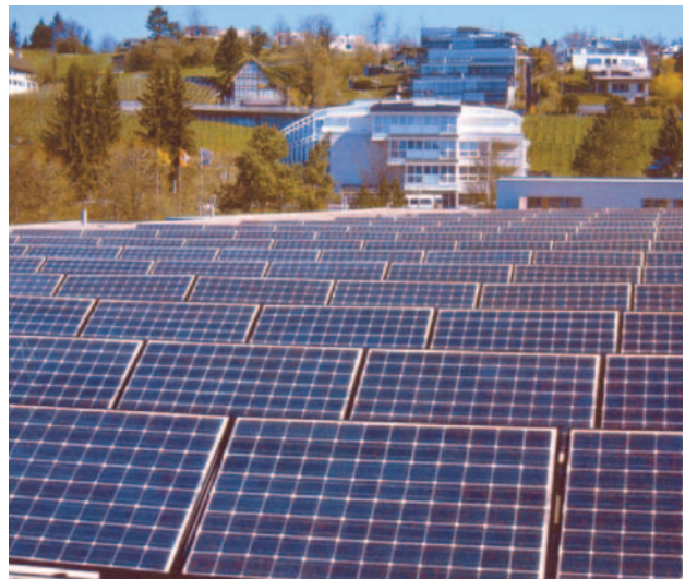
Fotomontage / Die 180 Solarmodule auf dem Dach des Schulhauses Breiti würden nach Süden ausgerichtet.

Aus ökologischen Gründen beauftragte der Gemeinderat das Elektrizitätswerk Herrliberg in Koordination mit der Energiekommission, Projektierungsarbeiten zur Erstellung einer Photovoltaikanlage auf dem Schulhaus Breiti aufzunehmen. Als mögliches Ziel sollte geprüft werden, ob der von den Herrliberger Stromkunden jährlich bestellte Solarstrom auf diese Weise in Herrliberg selbst erzeugt werden kann.