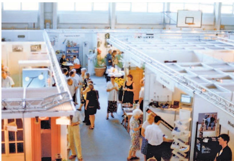
Die nächste HEGA findet 2010 statt.