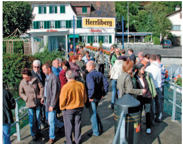
Der Gewerbeverein Herrliberg bei guter Laune am Schiffssteg, kurz vor der Sommerschiffahrt nach Rapperswil.

Auf das einheimische Gewerbe ist Verlass. Die Leute sind vor Ort, die Beratung ist persönlich, die Motivation für eine qualitativ gute Erledigung des Auftrages ist gross und für allfällige Zusatzdienste ist der Anbieter vor Ort oder man trifft sich eh im Dorf. Die Mitglieder des Gewerbevereins sind mehr als reine Geschäftspartner. Sie engagieren sich für das Dorfleben und bereichern den Alltag von Alt und Jung. Marktstimmung kommt am Frühlings- und Herbstmarkt auf. Der alle zwei Jahre stattfindende Seniorenausflug (Zusammenarbeit mit der Gemeinde) erfreut die älteren Einwohner. Der Samichlaus bringt nicht nur "Öpfel und Bire" sondern auch 10% Rabatt in zahlreichen Geschäften. Aber auch die Weihnachtsbeleuchtung und das Gemeindetelefonbuch (beides mit der Unterstützung der Gemeinde) und die alle paar Jahre stattfindende Gewerbeausstellung (HEGA) bereichern das Dorfleben.