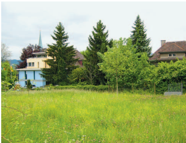
Grundstücke in unmittelbarer Nähe des Gemeindehauses zu kaufen

Die Parzellen liegen in der zweigeschossigen Wohnzone (W2/30) mit einer Ausnützungsziffer von 30 %, was gesamthaft bei einer Arealüberbauung eine maximale Ausnützung von 40 % ermöglichen würde. Diese Ausnützung ist für den Dorfkern eher tief und gilt nur im Bereich zwischen Pfarrgasse, Glärnisch- und Grütstrasse. An der Gartenstrasse könnte z.B. bei gleicher Grundstückfläche mit einer Arealüberbauung eine Ausnützung von 65 % erreicht werden. Diese Tatsache wirkt sich auf den Landpreis leicht reduzierend aus. Andererseits sind die Landpreise in den letzten Jahren in Herrliberg gestiegen und liegen aktuell für Bauland in der Regel zwischen 1'500 und 3'000 Franken pro m 2 . Von diesen Zahlen ausgenommen sind Seegrundstücke, wofür Liebhaberpreise bezahlt werden. Die Bewertung des Landes kann unterschiedlich erfolgen, indem auch das Gebäude Forchstrasse 11 einbezogen oder nur das Land angerechnet wird. Das vom Architekten des Gemeindehauses 1927 zwei Jahre nach dem Gemeindehaus erstellte Gebäude "Schöngrund" weist den gleichen Charakter auf. Es ist nicht inventarisiert und eine Schutzverfügung steht nicht zur Diskussion.