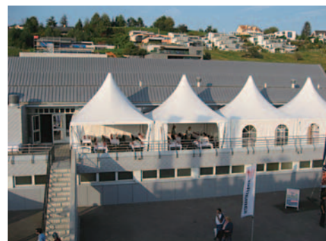
Die Sporthallenterrasse war in ein Festzelt umgewandelt.

Im letzten Herrliberger war das Jahrhundert-Fussballspektakel auf dem Langacker samt der Einweihung des Kunstrasens noch angekündigt worden. Inzwischen ist der Alltag eingeleitet. Der FC Herrliberg spielt seit der erfolgreichen und ehrenvollen Lehrstunde (0:6) munter und mit positiven Resultaten weiter, gebrochene FCZ-Nasen sind wieder geheilt und die Gemeinde Erlenbach trainiert für ein Revanchespiel gegen die Behördenauswahl von Herrliberg.