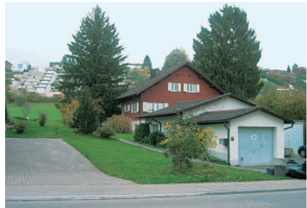
Wohnhaus mit Garagengebäude, zürichseits der Tennisplätze

Das Haus stammt aus dem Jahre 1936 und das Garagengebäude wurde 1957 erstellt. Das Areal umfasst einen Bauzonenteil von knapp 1800 m 2 und ist in der Bilanz mit rund 700'000 Franken bewertet.