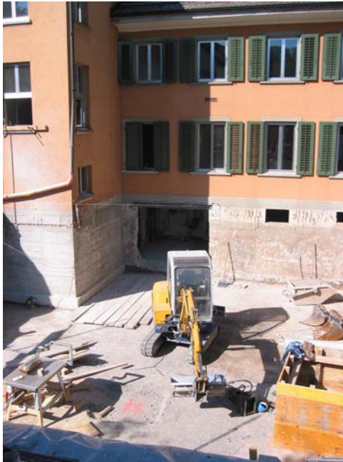
Bagger im zukünftigen Archiv