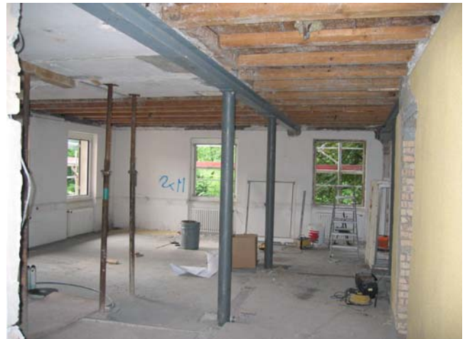
Dachausbruch für Personalraum