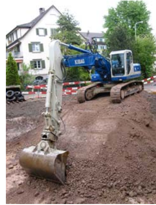
Aushub für Anbau