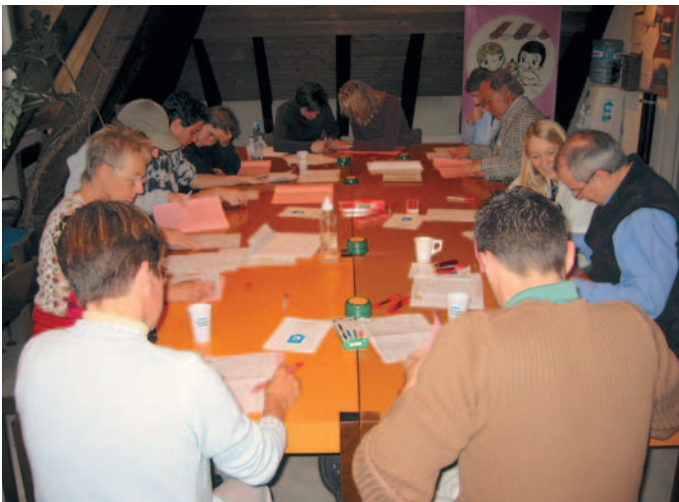
Wahlbüro im Einsatz

Die Gemeindekanzlei beantwortet gerne allfällige Fragen und nimmt Kandidaturen bis Ende März 2006 schriftlich entgegen.