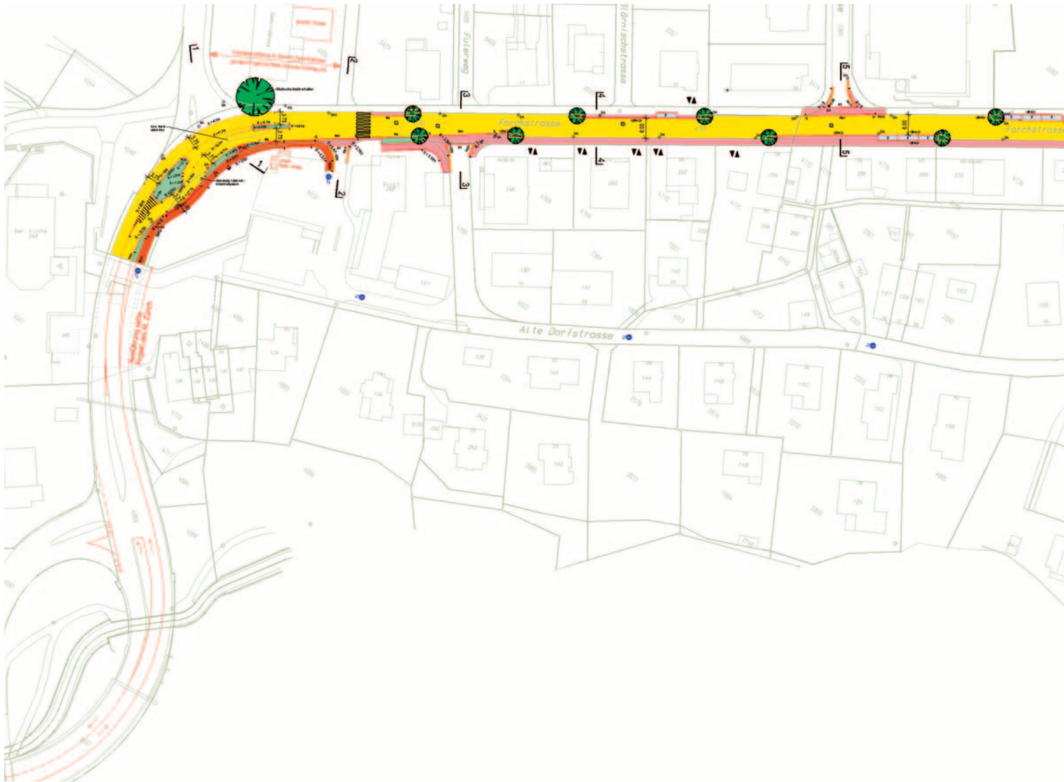
Teilstück beim Gemeindehaus