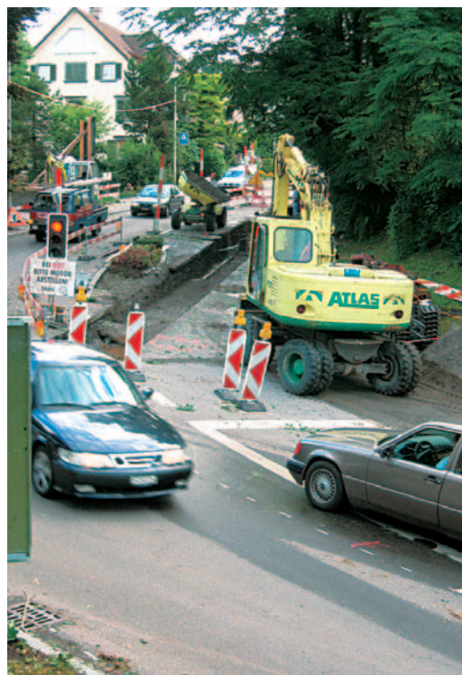
Baustelle für die Leitungserneuerungen am 13.8.04

Die Gelegenheit ist deshalb wahrzunehmen. An der Gemeindeversammlung vom 16. Juni war intensiv und vorwiegend kritisch über die Umgestaltung diskutiert worden. Die Rückweisung hat dem Gemeinderat gezeigt, dass eine Beruhigung erwünscht, das Projekt jedoch anzupassen ist. Im Vordergrund stand der Bereich beim Gemeindehaus und der Post. Die neue Trottoirführung sowie die Befürchtung, dass eine Buche gefällt werden.