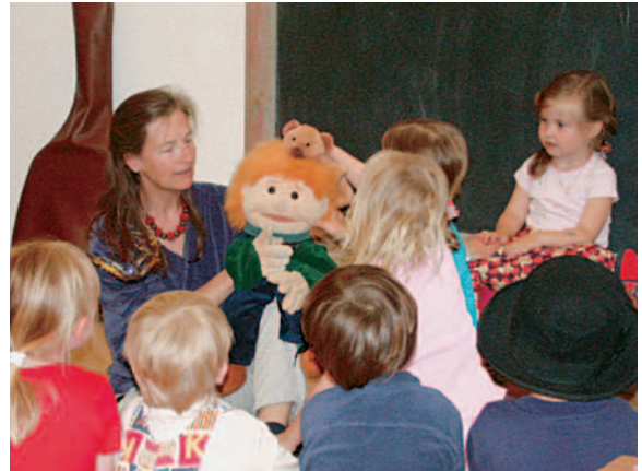
Kinder lernen spielerisch

Schon seit fünf Jahren öffnet das Familienzentrum Robinson täglich seine Türen. 330 Erwachsene und Kinder treffen sich da jede Woche am Herrliberger Dorfplatz. Das Angebot ist riesig und reicht von der Mütterberatung über Kinderhüeti, Chrabbeltreffs, Spielgruppen, Schülermittagstische, Kaffeetreffs, Kinderfeste, Vorträge, bis zu Bastel- und Weiterbildungs-Kursen. Die grosse Pinnwand informiert über die aktuellen Aktivitäten für Eltern und Kleinkinder. Eine Bibliothek steht für Fragen von Eltern und Kleinkindern zur Verfügung. Die MitarbeiterInnen im Zentrum geben Ratsuchenden gerne Auskünfte.