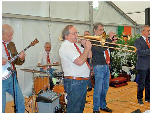
Die Unterhaltung war jubiläumswürdig.