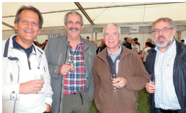
Auch die Erlenbacher Prominenz war vertreten!