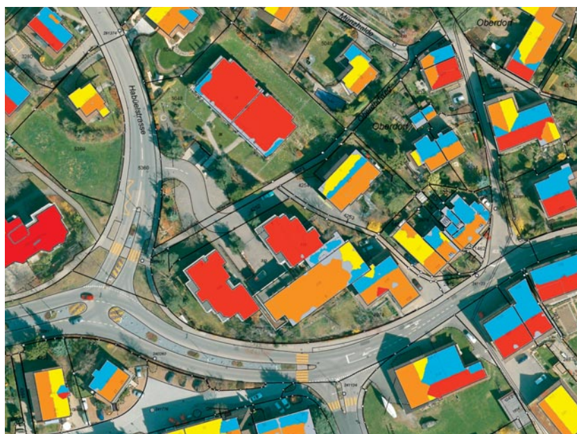
Ausschnitt aus dem Solarkataster

Der Solarkataster ist auf www.herrliberg.ch unter «Ortsplan / GIS-Herrliberg» verfügbar